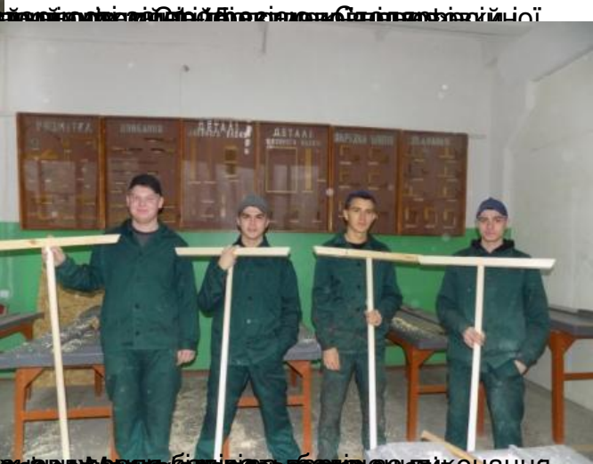
Фотозвіт про участь у конкурсі фахової майстерності з напрямку "Будівельна галузь" у м. Київ