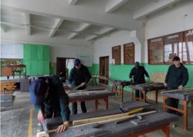
Фотозвіт про участь у конкурсі фахової майстерності з напрямку "Будівельна галузь" у м. Київ