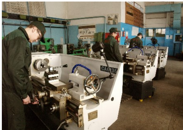
Виробниче навчання верстатників широкого профілю в навчально-виробничих майстернях

Педагогічний колектив училища створює систему навчання, яка б задовольняла кожного учня відповідно до його схильностями, інтересами і можливостями. Саме вчитель, а не комп'ютер є найважливішою складовою навчального процесу. Для ефективного використання комп'ютерів при навчанні вчитель повинен опанувати не лише теоретичні знання а й практичні навички. Для цього всі педагоги, починаючи з 2007 року навчаються за програмою «Інтел ® Навчання для майбутнього.»