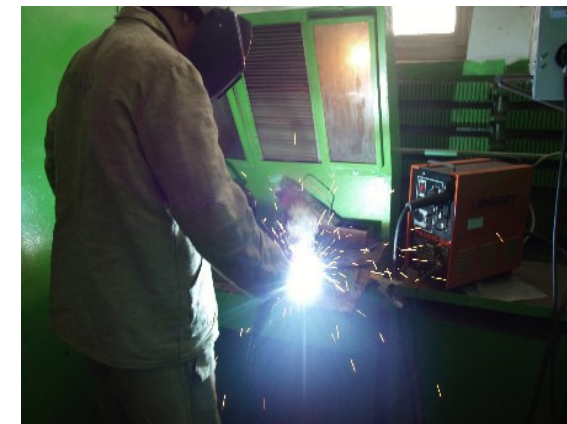
Нова професія - зварювальник проходить опробування у ВПУ-7

Училище приймає участь в інноваційній державною програмою підвищення кваліфікації майстрів